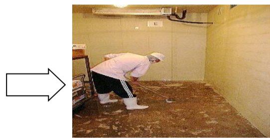
○デッキブラシを使用し、ブラッシングを行う