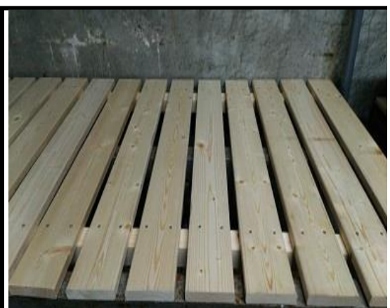
* 冷凍庫・冷蔵庫内の台の汚れ

・通常は、整理・整頓、汚物・肉片を除去、霜の除去を行い、冷蔵庫類の点検(KCPE-7)で確認する。