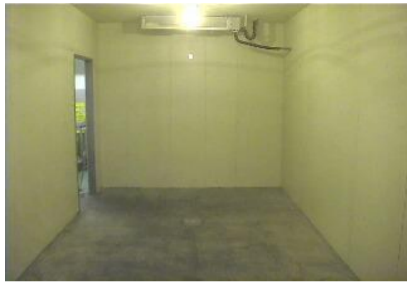
○商品等をすべて作業場へ出す