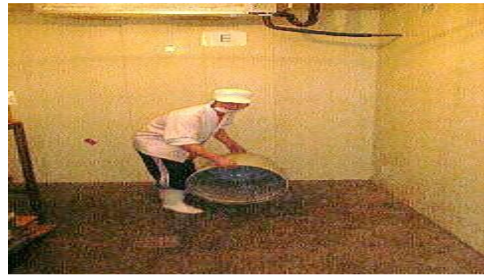
○水で流す(貯め水で)