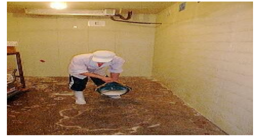
○稀釈したアデカ77を流す