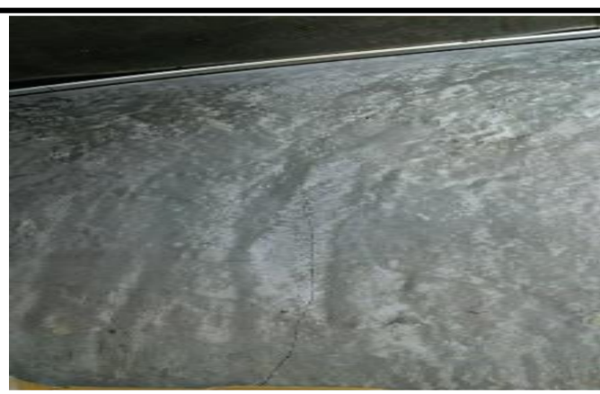
* 2階の冷凍庫・冷蔵庫の壁