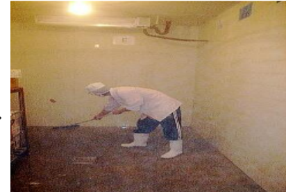
○ドライワイパーでよく水を切る