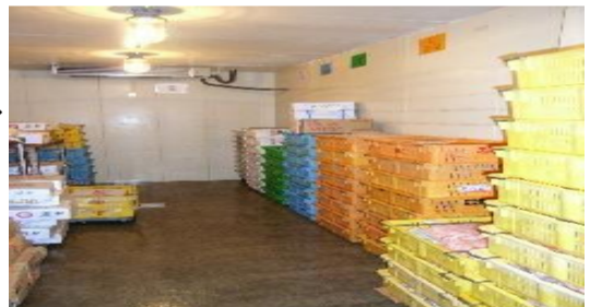
○商品等を冷蔵庫へ入れる