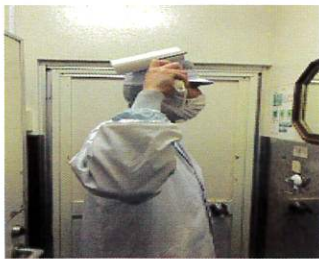
○ローラーをかける。頭