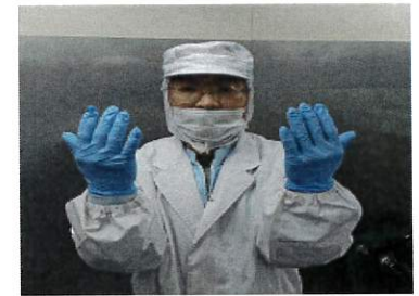
○手袋 天然ゴム極薄手袋使用