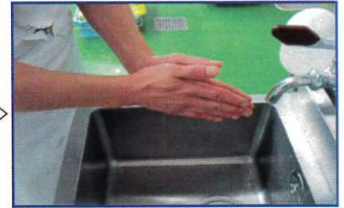
○両手のひらをよくこする