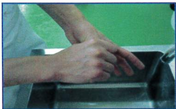
○親指と手のひらをねじり洗う