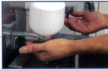
○洗剤を手にとり、よく泡たてる