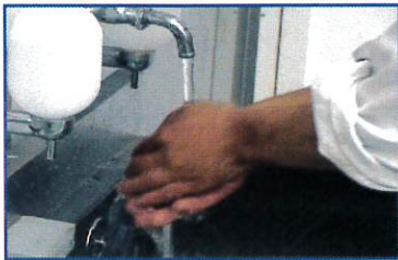
○水で手を湿らせる