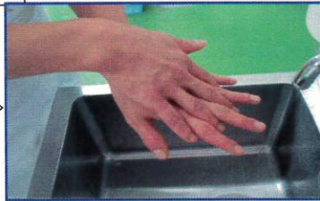
○手の甲をよくこする