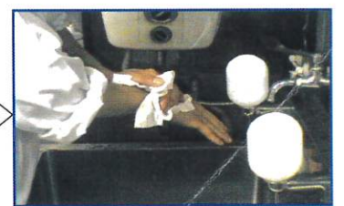
○ペーパータオルで水分を拭取る