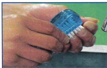
○爪ブラシを使い、爪の間をよく洗う