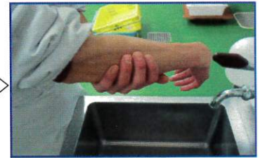
○腕をよく洗う(ひじ付近まで)