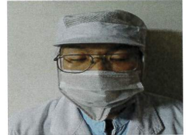
○マスク 鼻まで被せる