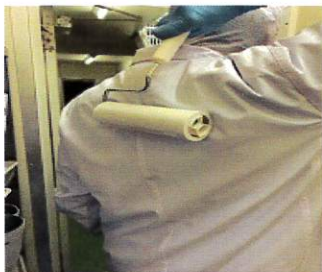
○最後、ローラーをかける。