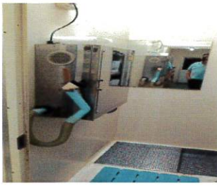
○クリーナーを使用する。